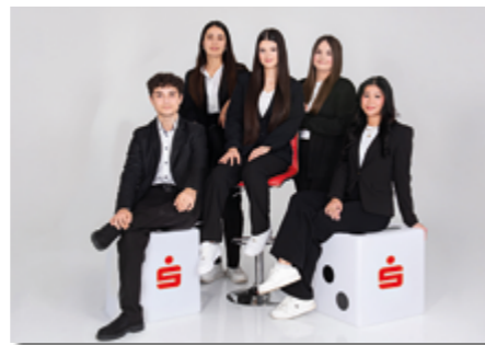
Unser Ausbildungsjahrgang 2025